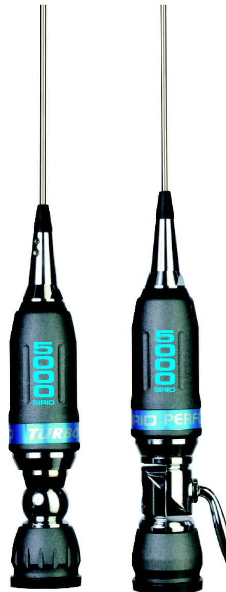
TURBO 5000 PERFORMER 5000