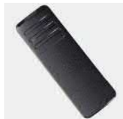
Зажим для крепления к поясному ремню BC39