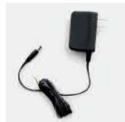
Адаптер питания PS1026