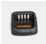
Зарядное устройство CH10L27