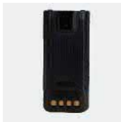
Литий-ионный аккумулятор BL1815-EX