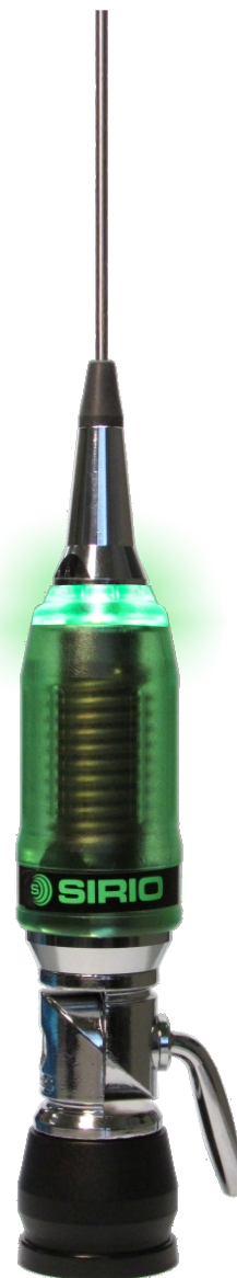
5000 Watts Low Loss Coil